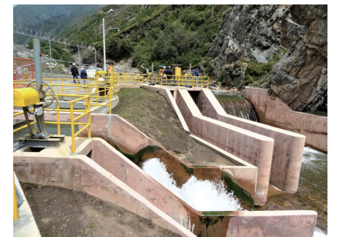
水力発電所の取水口(パルカ鉱山近郊)