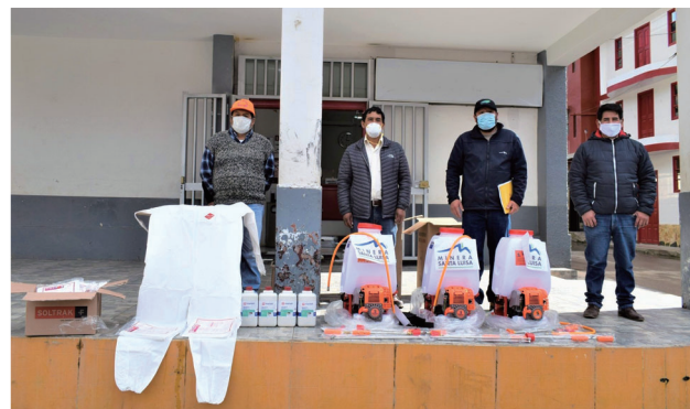
ワジャンカ村への支援物資の提供

ワンサラ鉱山・パルカ鉱山を操業するサンタレイサ鉱業では鉱山周辺の地域コミュニティとのエンゲージメントを重視し、コミュニティのニーズに沿ったインフラの整備、教育・人材育成の支援、農畜支援を継続的に行なっています。2020年度は食料品、マスクや消毒液、消毒液噴霧器等を寄付し、COVID-19の影響を受けた地域コミュニティを支援しました。